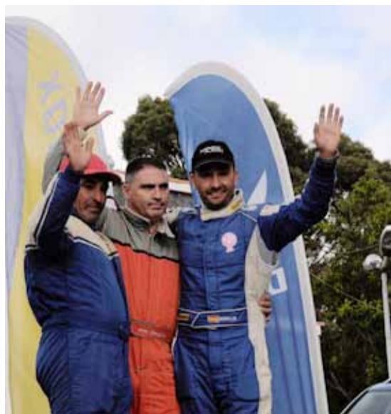
Podio de barquetas.

Texto: Redacción