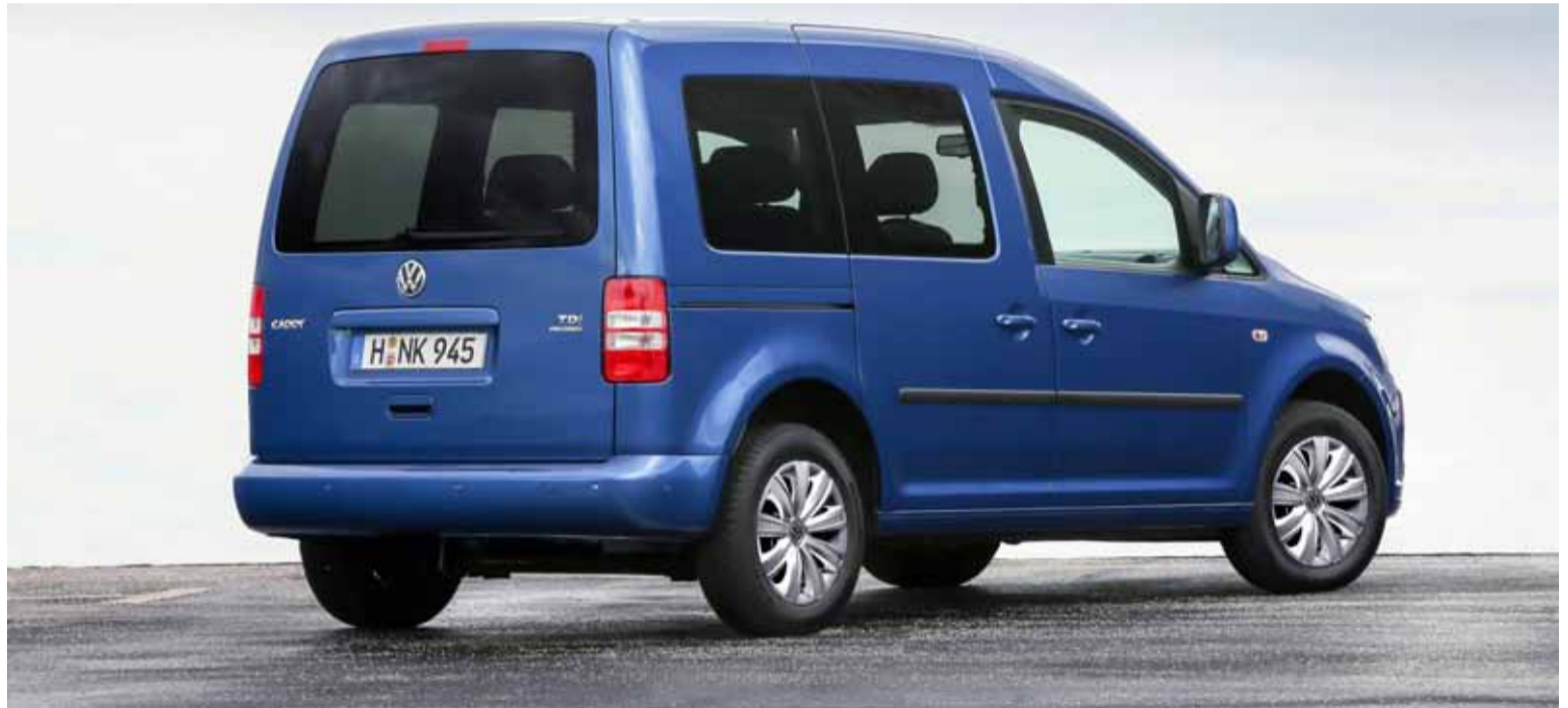
La nueva Caddy tiene importantes mejoras en equipamiento, pero sobre todo en cuanto a consumo y emisiones.