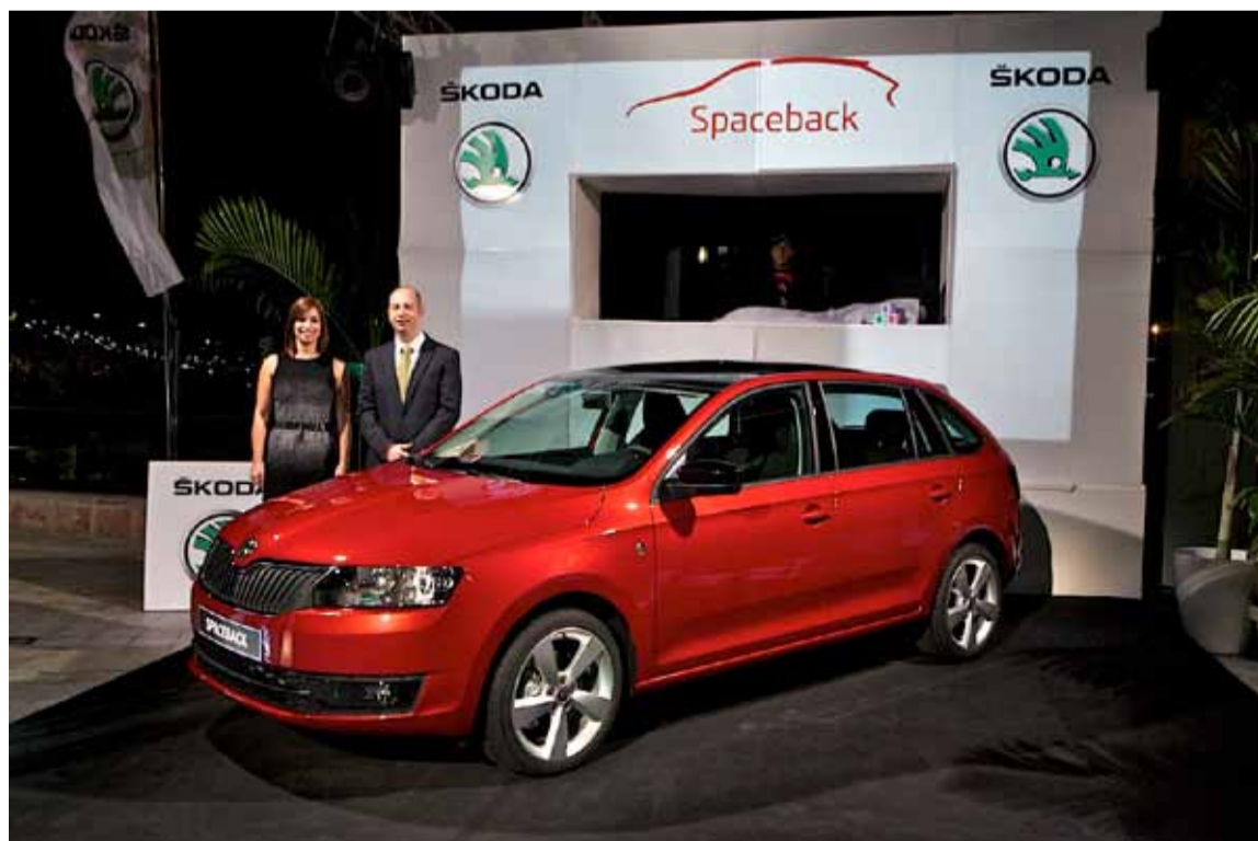
Cuatro nuevos colores metalizados están disponibles para el Spaceback: Gris Metálico, Rojo Río, Azul Race y Blanco Luna.