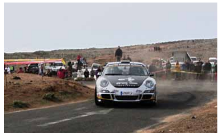
3º absoluto. Fuster/Cue acabaron subcampeones del Regional de Canarias.