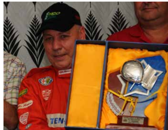
Monchi ha cosechado y sigue cosechando muchos trofeos.