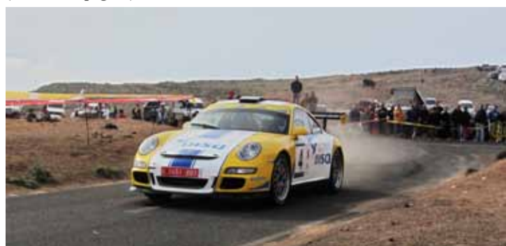
3º absoluto. Gran carrera de Cruz/Bonilla. No pudieron con Fuster/Cue.