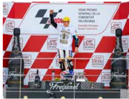
Podio de Moto3. M. Viñales, Campeón.

No podemos decir que Maverick Viñales no se merezca el título, pero si es cierto que era el que menos estaba en las previsiones. Siendo el más regular durante todo el año, y teniendo como peor resultado un 5º puesto, el piloto del Team Calvo no ganaba una carrera desde Francia, es decir, desde la cuarta carrera. Salom, que lideró el campeonato mucho tiempo, llegaba de nuevo como líder y Rins, que perdió una oportunidad de oro en Japón cuando logró el segundo