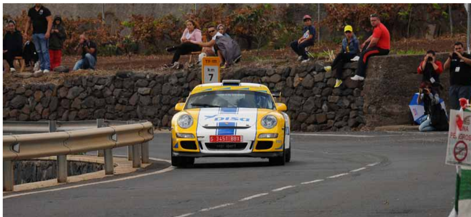
Enrique Cruz hizo valer la potencia de su Porsche GT3 para adjudicarse la subida y el Campeonato Autonómico de Montaña 2013.