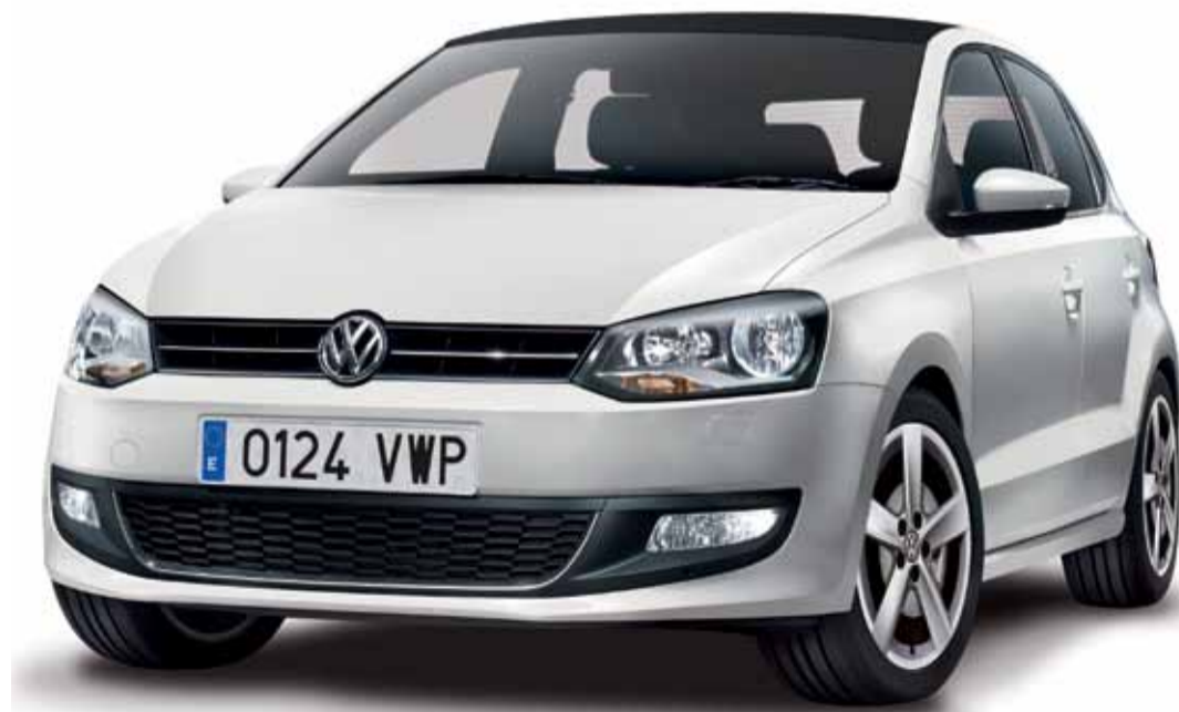
El Polo es uno de los modelos más atractivos la marca y, ahora, lo es aún más gracias a este modelo de acción sesenta aniversario.

En el diseño exterior, elementos como el techo panorámico y las llantas de aleación