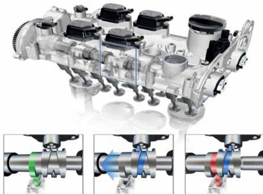
Todos los componentes de la gestión activa de cilindros pesan sólo 3 kilos en total.