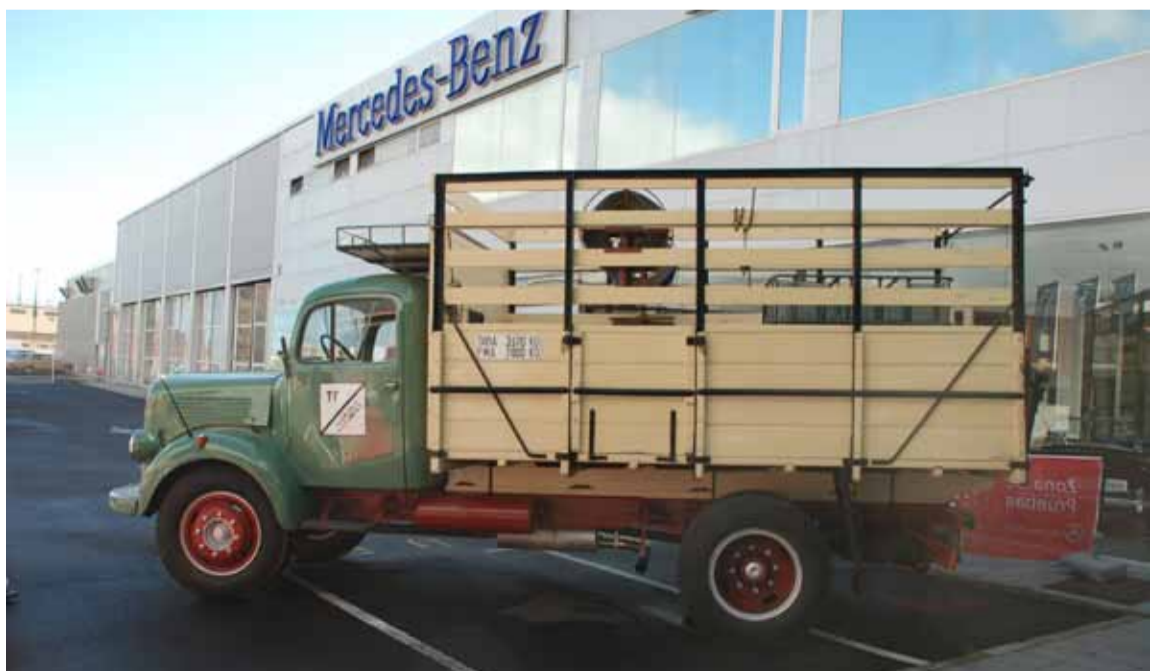
También los comerciales están representados en el Club. Un magnífico camión que se encuentra en plena forma y trabajando.