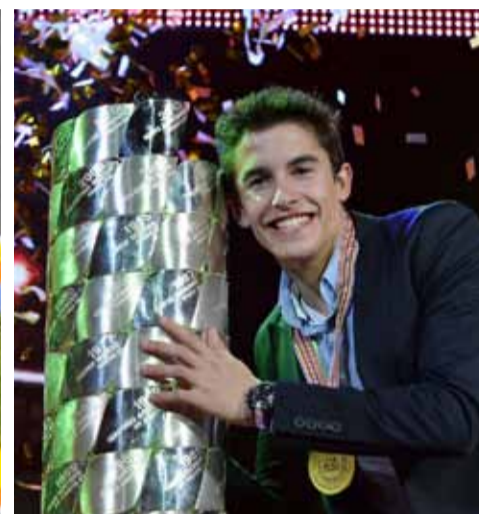
Marquez ha batido todos los registros.