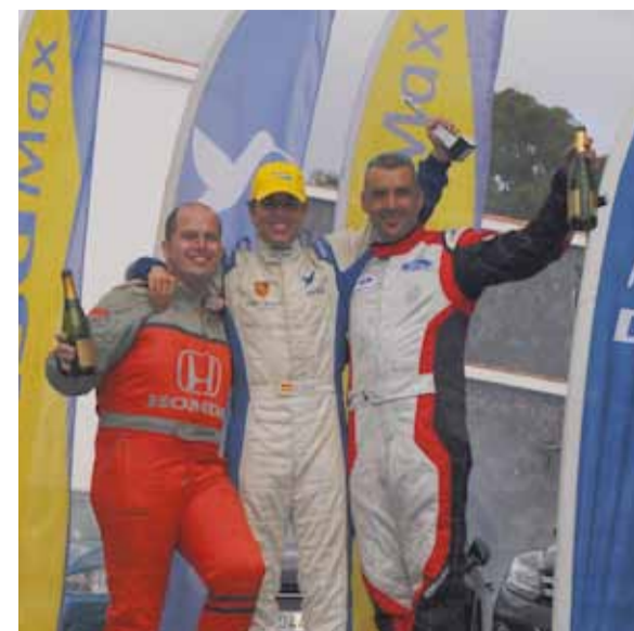
Podio de carrozados