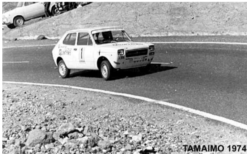
Eran los inicios con el Seat 127 en una de sus primeras participaciones en subidas.