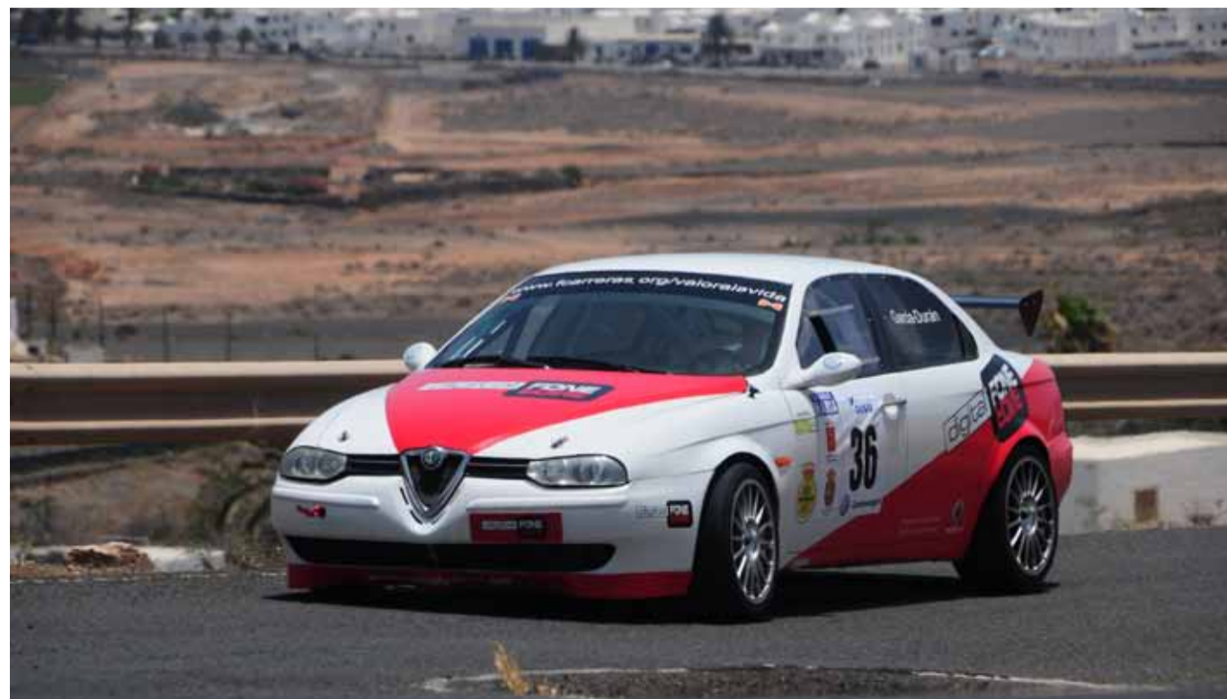
Con su Alfa 156 es un asiduo en todas las subidas en cuesta y no perdemos la esperanza de volver a verlo en algún rallye (¿con Natalia?).