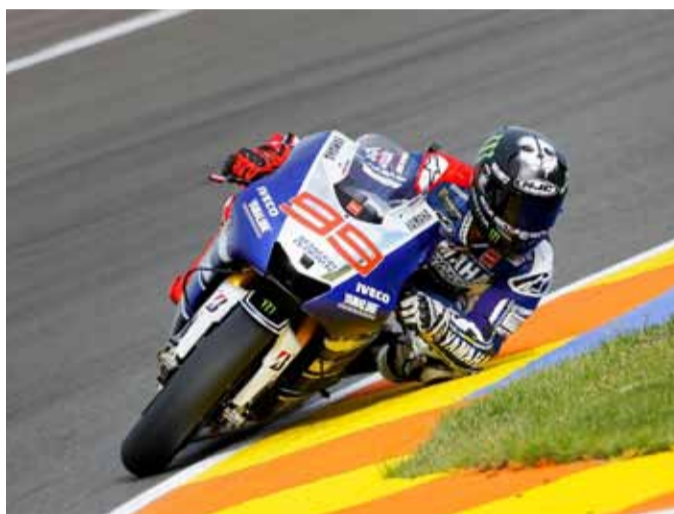
Venció Jorge Lorenzo pero no fue suficiente para ser Campeón 2013.