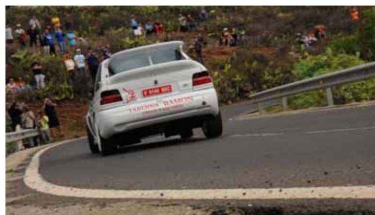
Berti Díaz completó el podio de carrozados.