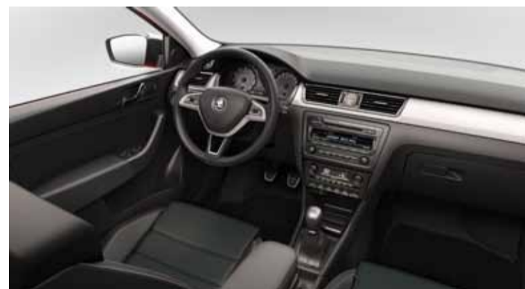
Completo y atractivo equipamiento.