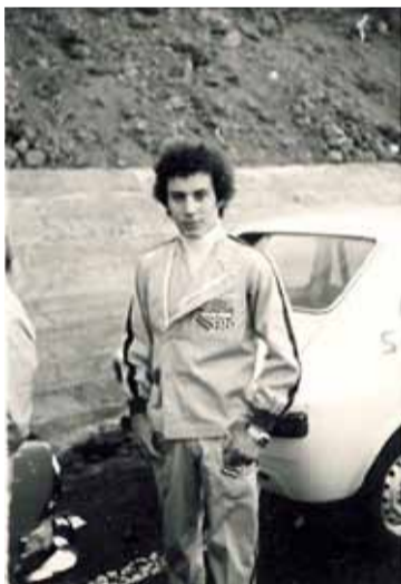
Monchi también fue un chaval.

Texto Redacción