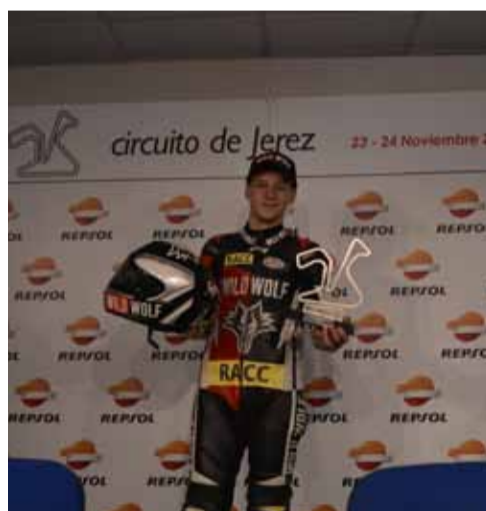
Quartararo campeón Moto3 in extremis.