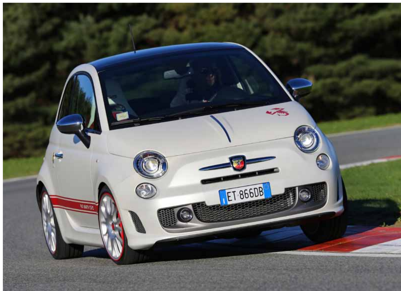
El espíritu del Fiat 595 Abarth pero con una importantísima puesta al día con la tecnología y el equipamiento del siglo XXI.