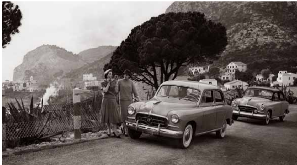
El Seat 1400 se empezó a fabricar en 1953 y se dejó de fabricar en 1964 tras vender más de 98.000 unidades