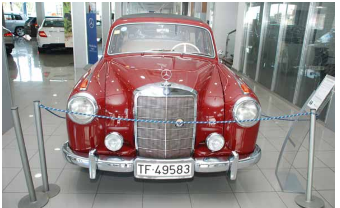
Entre la muestra expuesta en los locales del Rahn Star pudimos admirar modelos perfectamente cuidados.