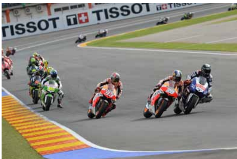
La carrera de Valencia atrajo con razón a los aficionados de forma masiva.