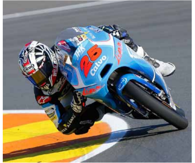
Maverick Viñales aprovechó sus opciones ganando la carrera en Valencia.