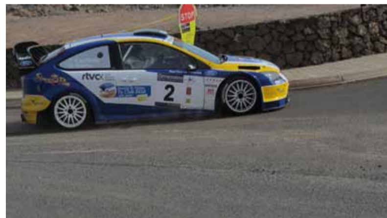
2º absoluto. Capdevila/Rivero Campeones Regionales de Canarias 2013.